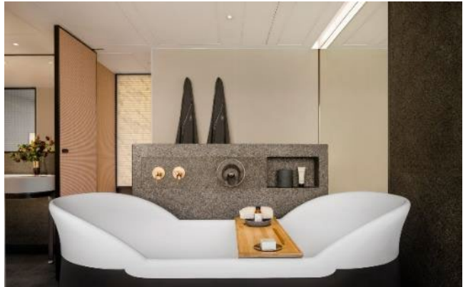
上圖: 豪華海景套房悠享綠洲浴室

出生於香港的當代著名設計師盧志榮 (Chi Wing Lo)，將其別樹一幟的工藝美學及清雅絕塵的設計特色融入於他的首個酒店專案當中。秉承他的設計哲學並憑其在建築、室內設計、家具及藝術設計的專業知識，以雋永美學糅合精湛的工藝及一絲不苟的選材方式重新詮釋香港麗晶酒店。室內設計選材天然橡木及花崗岩，透過靜謐的設計營造一室寧靜淡雅的氛圍，