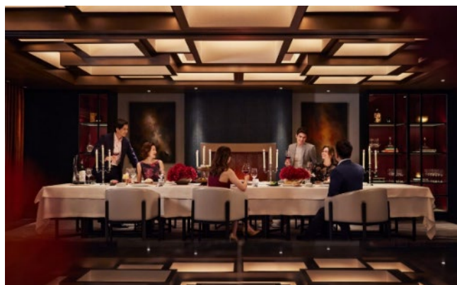
上圖: The Steak House 私人廂房

香港麗晶酒店匯萃 6 種享譽國際的餐飲體驗，呈獻精選珍饈，廣納新晉廚藝人才，融匯豐富的本地美食及文化。客人可以在榮獲米芝蓮二星的 麗晶軒 探索粵菜之文化瑰寶；在 The Steak House 享受到世界頂級的牛扒盛宴及美酒；港畔餐廳 Harbourside 國際自助餐匯聚最時令新鮮的食材，目不暇給，猶如讓人置身於熙來攘往的珍饈市場之中；於大堂酒廊 The Lobby Lounge ，客人